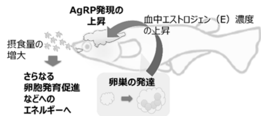
図 2 繁殖期特異的な摂食行動の機構

繁殖期には卵成熟などに多くのエネルギーを必要とするため、摂食行動と生殖も強く結びついている。例えば、クロダイは繁殖期に餌の多い浅瀬に移動することが経験的に報告されている。このような行動は生殖のための摂食行動であると考えられる。一方、マウスやゼブラフィッシュなど多くのモデル生物は繁殖期を喪失もしくは持たないために、その神経メカニズムについては不明であった。私たちは、メスメダカが非繁殖期に比べ、繁殖期に餌を多く食べることを見出し、メスメダカをモデルに繁殖期依存的な摂食促進機構について解析した。繁殖期と非繁殖期のメスメダカの全脳 RNA-seq を行った結果、摂食に関わる神経ペプチドのうち、アグーチ関連ペプチド (Agouti-related peptide, AgRP) と神経ペプチド Y (Neuropeptide Y, NPY) が非繁殖期に比べて繁殖期に発現が高いことが明らかとなった。さらに、幼魚や卵巣除去個体を用いた解析から、繁殖期に成熟した卵巣から産生・放出される性ステロイドホルモン、エストロジェンが脳へ作用し、AgRP の発現を上昇させることが示唆された。また、AgRP をノックアウトしたメダカ ( agrp ノックアウト) を作出し、摂食量を解析したところ、WT に比べて agrp ノックアウトメダカの摂食量が少ないこと、 agrp ノックアウトメスは繁殖期と非繁殖期で摂食量に顕著な違いが見られないことが明らかとなった。さらに、 agrp ノックアウトメスと WT オスをペアにしたところ、WT のペアと比べて agrp ノックアウトメスの産卵数が少なく、 agrp ノックアウトメスの卵巣は WT の卵巣より小さい傾向を示した。以上より、繁殖期依存的な摂食量増加は、繁殖期に成熟した卵巣から放出されるエストロジェンが脳の AgRP 発現ニューロンにおける agrp 発現を上昇し、摂食行動を促進することが示唆された (8) 。そして、繁殖期には多く摂食することで、より卵胞発育を促し、多くの卵を得るといったポジティブフィードバックが働いている可能性が高い (図 2)。